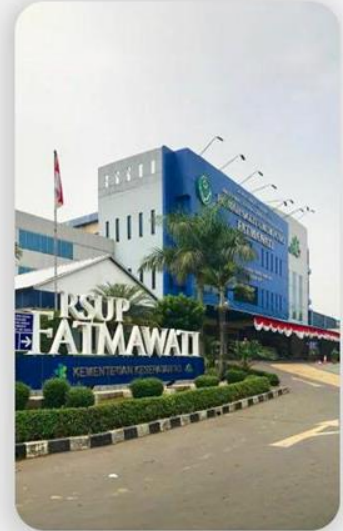
15 MENIT Rumah Sakit Fatmawati