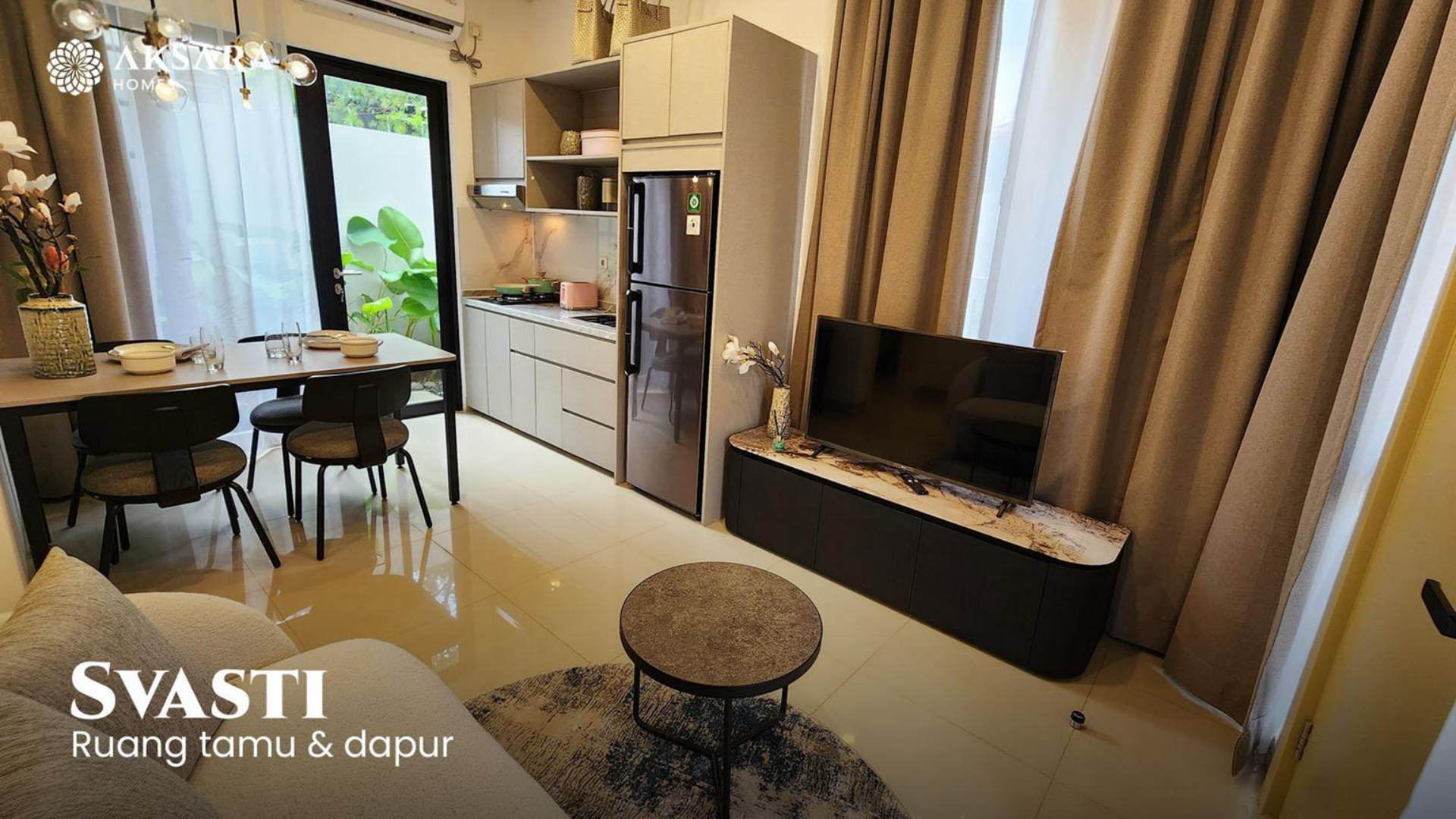
SVASTI Ruang tamu & dapur