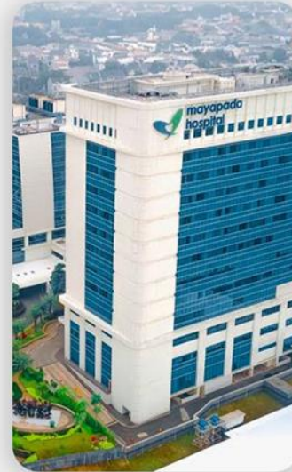
12 MENIT Rumah Sakit Mayapada Jakarta Selatan