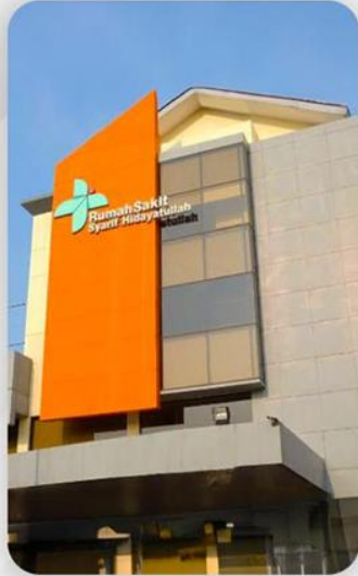
5 MENIT Rumah Sakit Syarif Hidayatullah