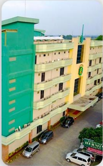
4 MENIT Rumah Sakit Hermina Ciputat