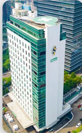
12 MENIT Rumah Sakit Siloam TB Simatupang