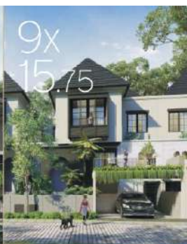
MARJORIA LT: 141.75 m 2 | LB: 206 m 2