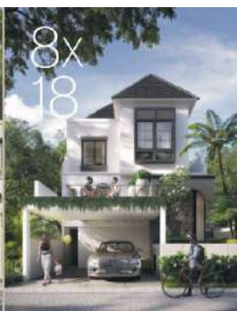
MALDRIAN LT: 144 m 2 | LB: 210 m 2