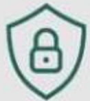
Keamanan 24 Jam