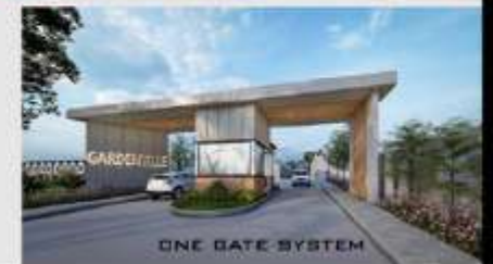
ONE GATE SYSTEM