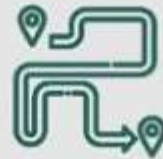
Area Jogging Track