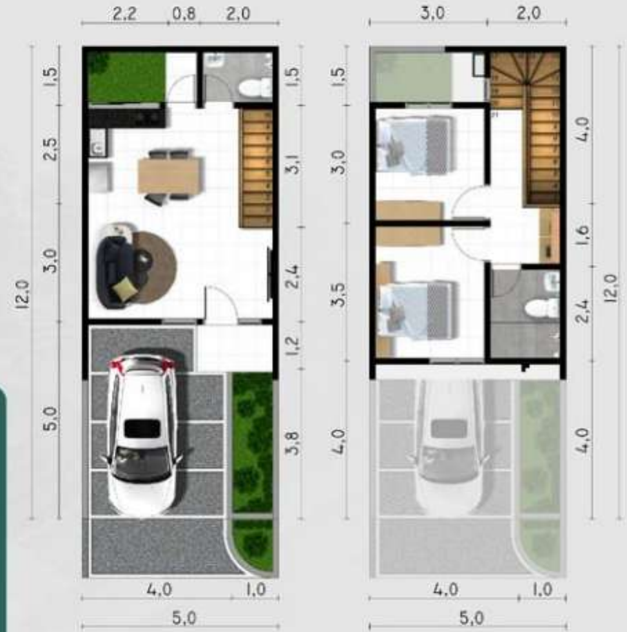
DENAH LANTAI 1 5m X 12m