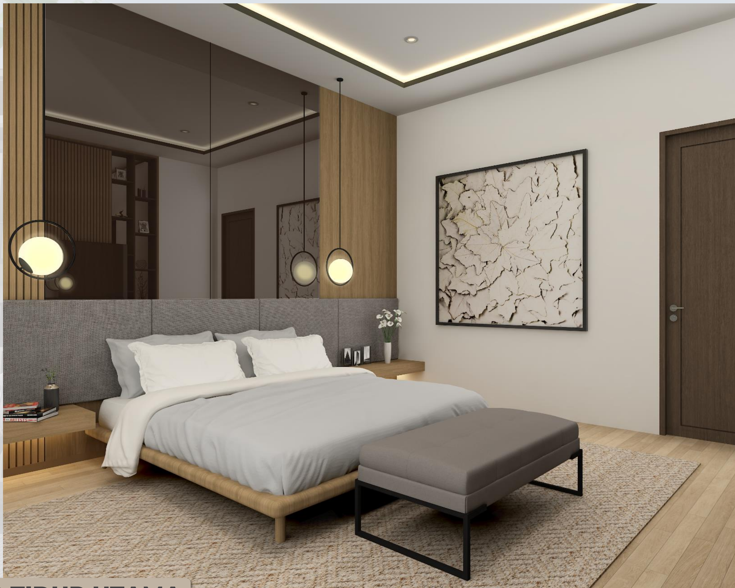
KAMAR TIDUR UTAMA