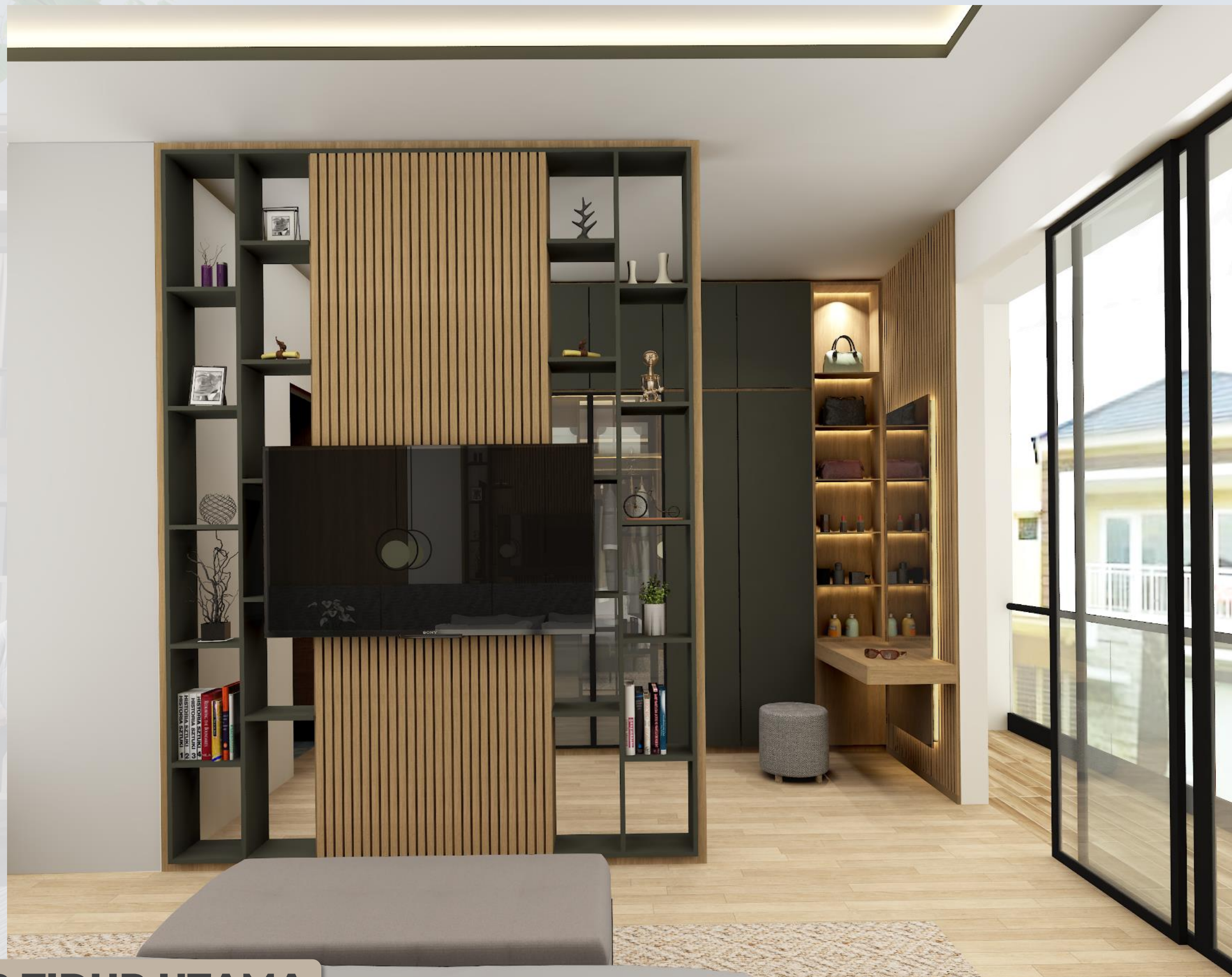
KAMAR TIDUR UTAMA